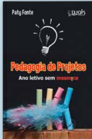
Pedagogia de Projetos: ano letivo sem mesmice - 1ª edição em 2014 - WAK Editora