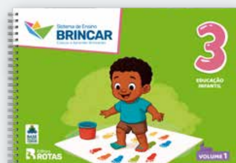
Sistema Brincar de Ensino 1, 2 e 3 anos – Educação Infantil – Volume 1 coautoria com Valéria Grafanassi, publicada pela Rotas em 2025.