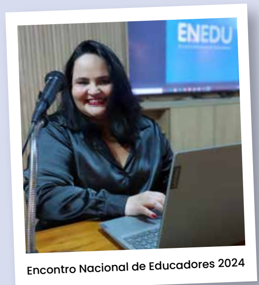
Encontro Nacional de Educadores 2024

Orientou o desenvolvimentos de centenas de projetos em escolas por todo Brasil.