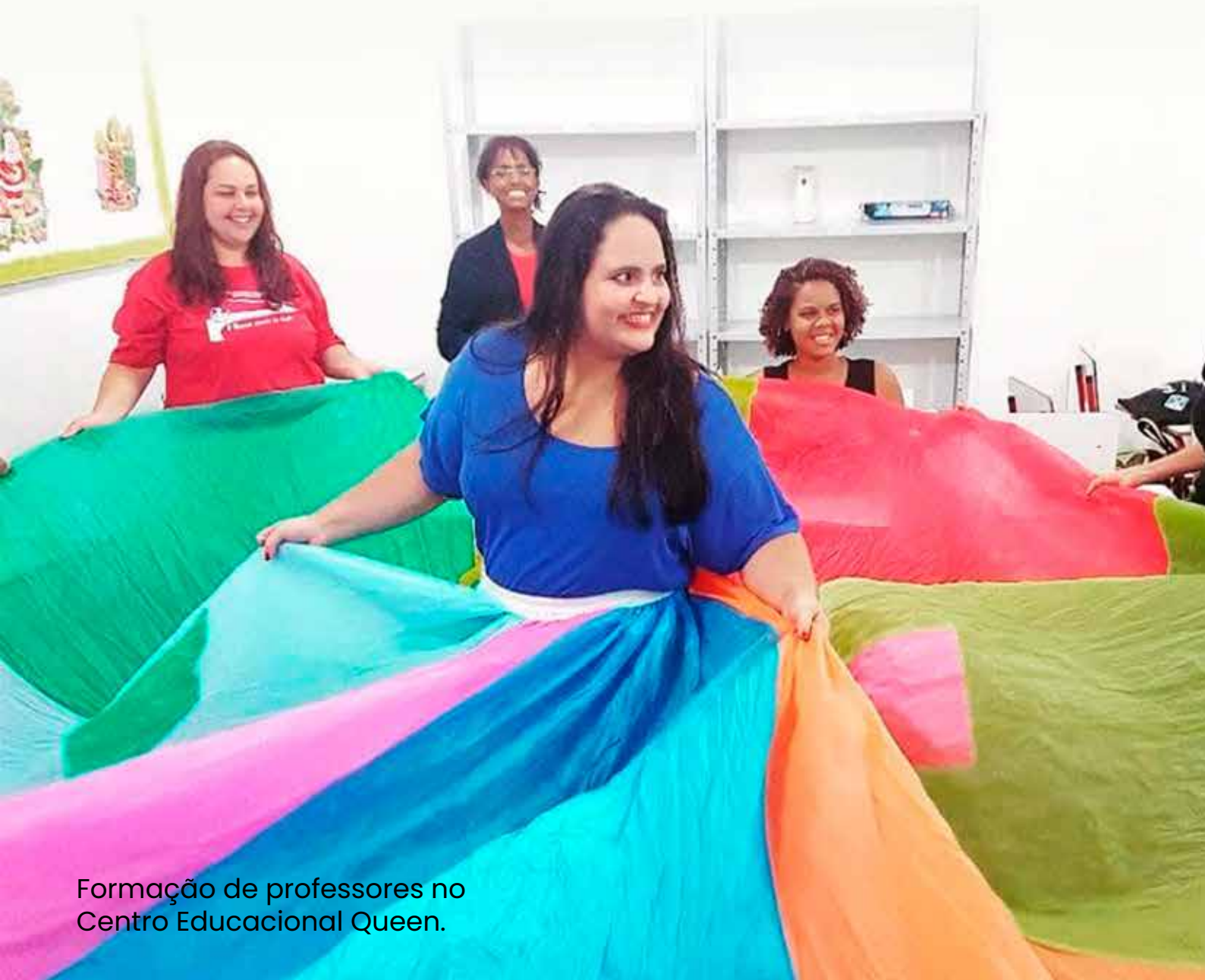
Formação de professores no Centro Educacional Queen.