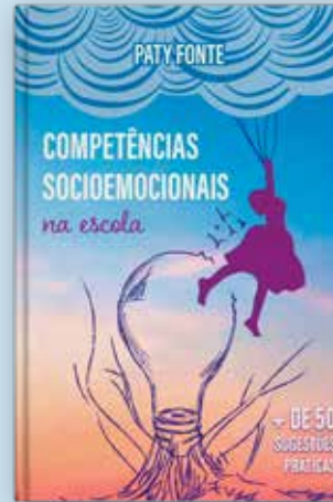
Competências Socioemocionais na Escola - 1ª edição em 2019 - WAK Editora