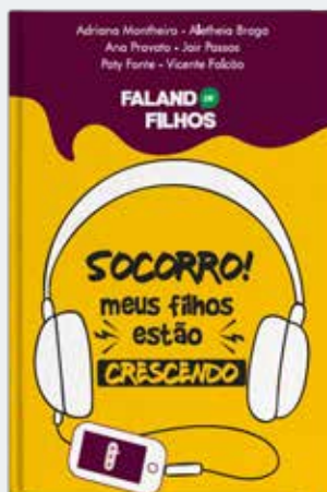
Socorro! Meus filhos estão crescendo – Coleção Falando de Filhos – Publicado em 2020 – Editora Nelpa.